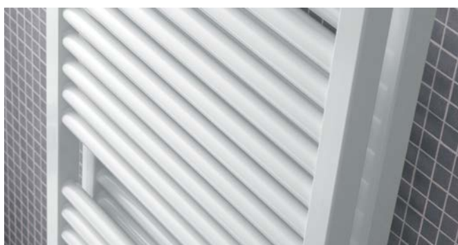
Ejecución de doble capa